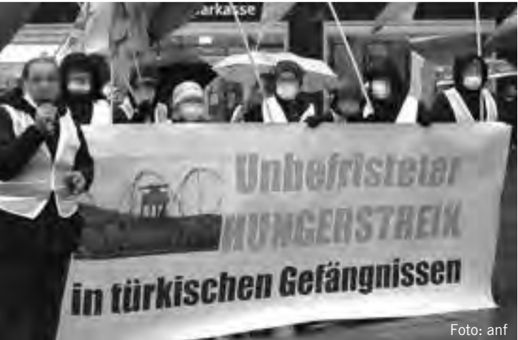
Solidaritätsaktion zur Unterstützung des Hungerstreiks der Gefangenen gegen Isolation und Folter in den Gefängnissen in der Türkei in Berlin am 19.01.2021

Gegen die lebensbedrohlichen, unter der Corona-Pandemie verschärften Haftbedingungen und die ständigen Rechtsverletzungen sowie für ein Ende der Isolation von Abdullah Öcalan befinden sich seit dem 27. November 2020 Tausende Gefangene in den türkischen Gefängnissen jeweils in Gruppen in einem Hungerstreik, auf den der türkische Staat mit verschärfter Repression reagiert. Auch in Deutschland finden zu den Forderungen der Hungerstreikenden viele Solidaritätsaktionen statt, an denen wir uns beteiligen sollten.