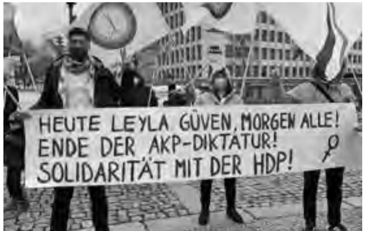
Bielefeld, 27.12.2020

Wegen der Proteste wurde ab Ende September 2019 eine Festnahmewelle losgetreten, die insbesondere im Jahr 2020 einen spürbaren Höhepunkt erreichte. In deren Folge ergingen zunächst offiziell für 82 Personen Haftbefehle. Später erhöhte sich dann jedoch die Zahl auf 108. Insgesamt wurden letztes Jahr im Rahmen dieses Verfahrens jedoch Hunderte Menschen festgenommen, um von ihnen Geständnisse zu erzwingen oder Falschaussagen zu erpressen. Im Januar 2021 endete das Hauptverfahren dann mit dem Ergebnis, dass sieben Personen zu lebenslänglichen Haftstrafen und die anderen Angeklagten ebenfalls zu mehrjährigen Haftstrafen verurteilt wurden. Im Zuge dessen wurde auch einer unbekannten Zahl an Politiker*innen der HDP die Immunität aberkannt; einige wurden zu Hausarrest oder Ausreiseverbot verurteilt.