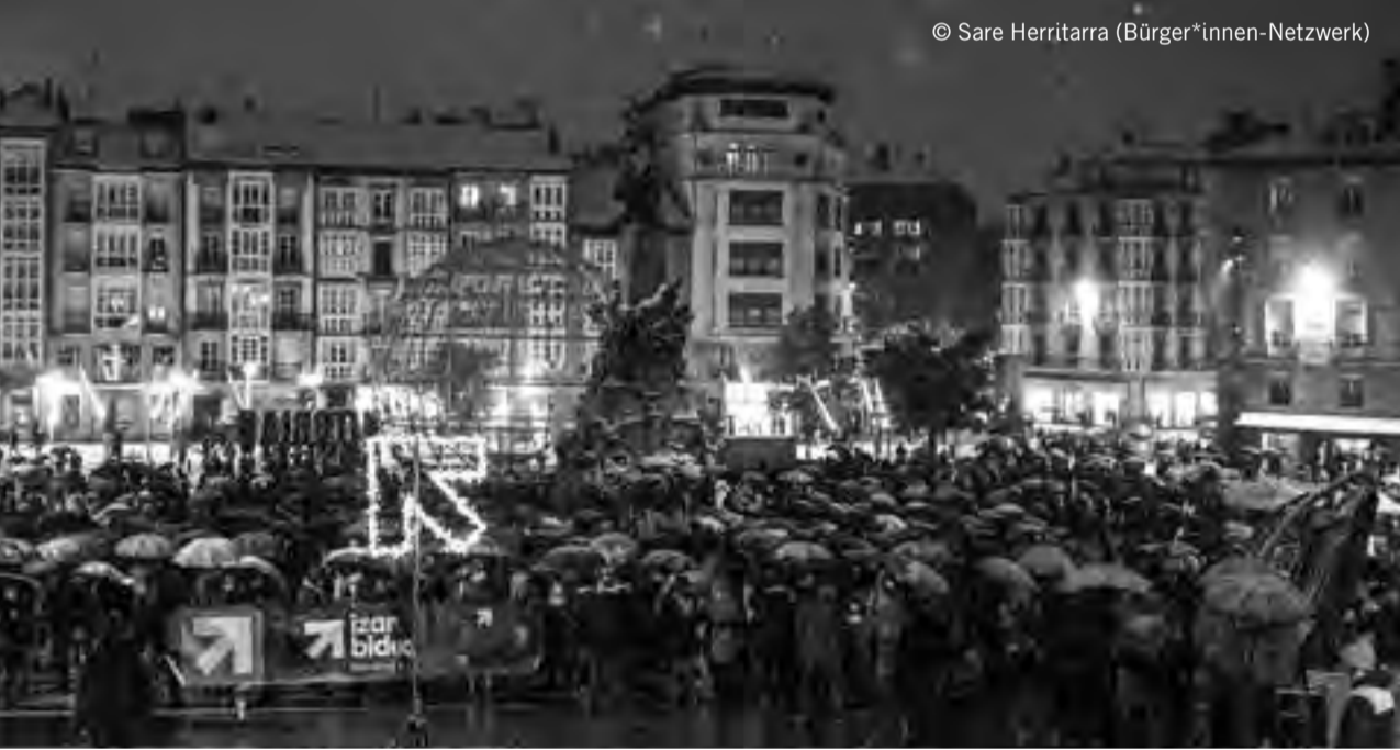
Protest in Gasteiz am 09.01.2021, IZAN BIDEAN – Wir sind auf dem Weg, İbilitarien sarea – gemeinsam

Andere Familienangehörige und Freund*innen glauben nicht, dass die Impfung in die Knäste kommt, jedenfalls nicht vor September 2021. Darüber nachdenken, ob wir für oder gegen die Impfung sind, können wir uns nicht einmal leisten. Wir wissen, dass Familien- und Intimbefuche nur dann gestattet werden, wenn wir geimpft sind. Es ist jetzt Anfang Januar, und ich habe ihn seit neuneinhalb Monaten nicht mehr in den Armen gehalten.