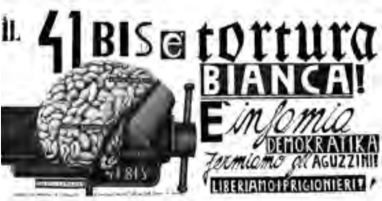
Der 41bis ist weiße Folter! Er ist eine demokratische Schande Stoppen wir die Folterer! Befreien wir die Gefangenen!

Das Haftregime gegen Linke hat in Italien eine lange Tradition: Je nachdem, welcher Maßnahme die Gefangenen unterliegen, werden sie in einem bestimmten Abschnitt des Gefängnisses festgehalten. Der schlechteste Ort auf der Skala der im Gefängnisssystem herrschenden Bedingungen ist die Einstufung in „41bis“. Der Artikel 41bis wurde vor 30 Jahren angeblich als vorübergehende und dringende Maßnahme eingeführt, existiert jedoch heute noch und wurde zusätzlich verschärft. Mit ihm wurde ein Haftregime geschaffen, das aus 23 Stunden Einzelhaft pro Tag, nur einem Besuch für eine Stunde pro Monat von engen Angehörigen durch Glas „gesichert“, der Verhinderung der physischen Anwesenheit der Angeklagten in den Prozessen durch den Einsatz von Videokonferenzen, Post- und Buchzensur usw. besteht. Um diesen Bedingungen zu entkommen, müsste die gefangene Person mit den Justizbehörden zusammenarbeiten. Selbst das Europäische Komitee zur Verhütung von Folter und unmenschlicher oder erniedrigender Behandlung oder Strafe beurteilte schon 1995 dieses Gefängnisregime als unmenschlich und erniedrigend.